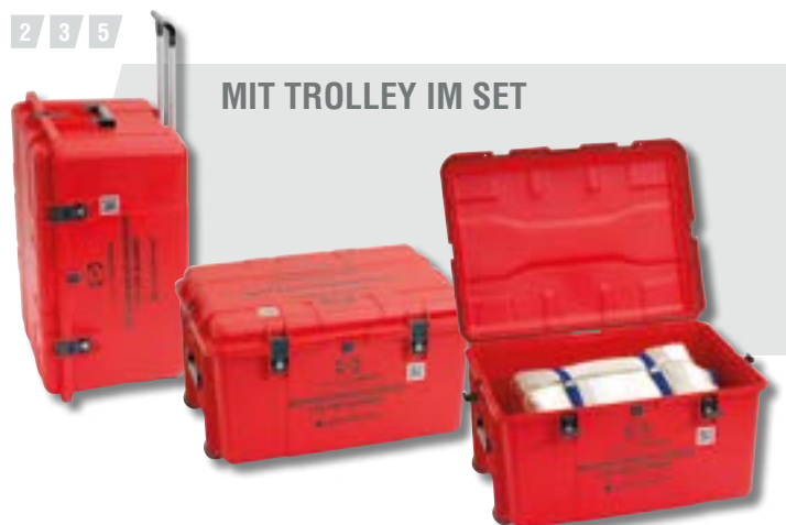
MIT TROLLEY IM SET