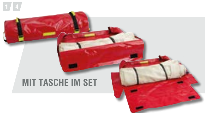
MIT TASCHE IM SET

5 Deckenmaß: 3.000 x 4.000 mm Material: Hochtemperatur-Gewebe Einsetzbar für kleine Fahrzeuggrößen, E-Bikes, E-Scooter u.ä.