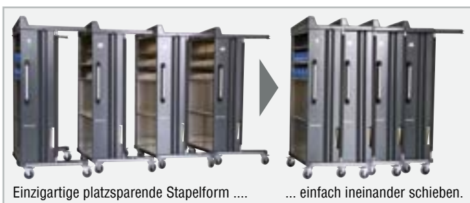
Einzigartige platzsparende Stapelform ....